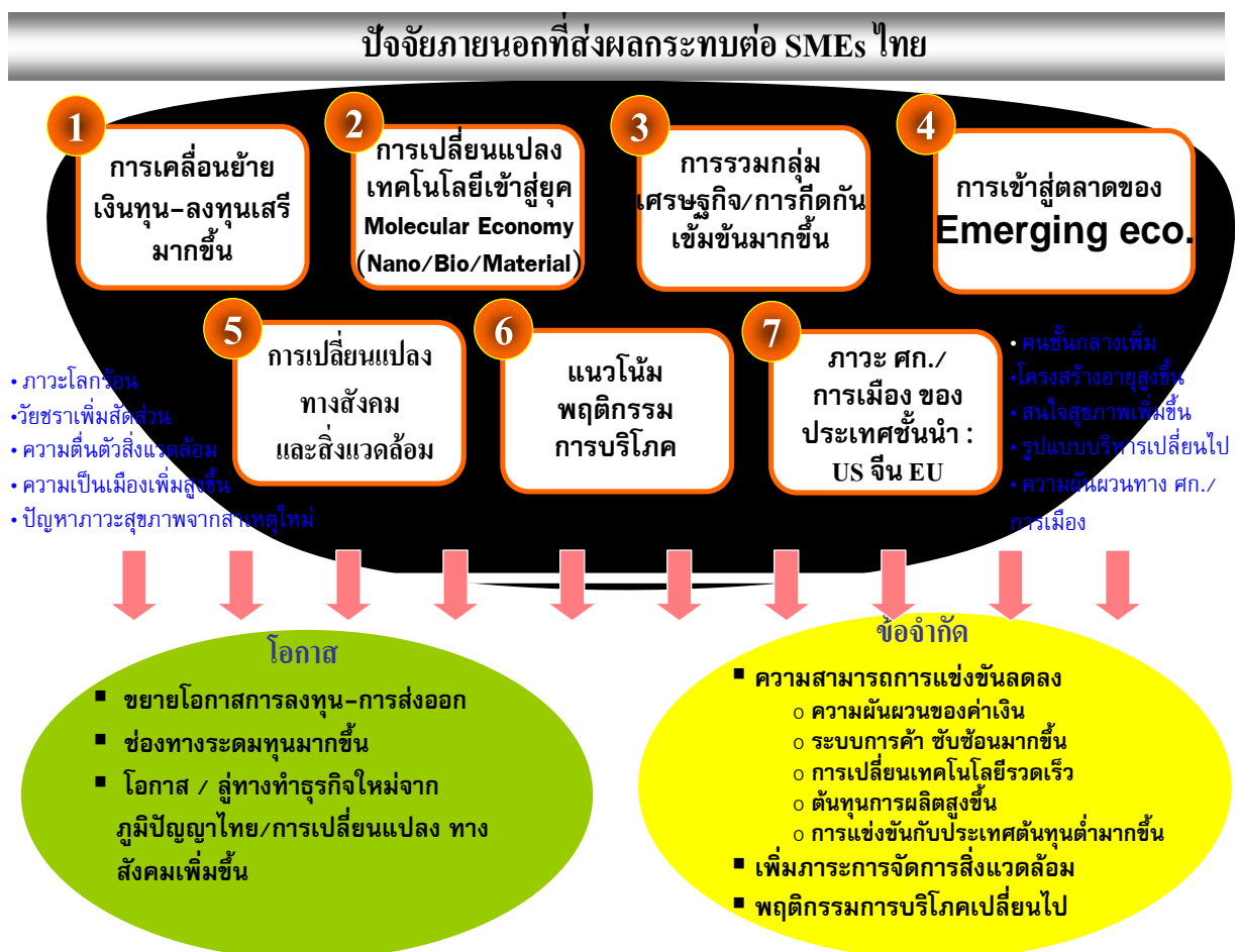
รูปที่ 1-2 สถานการณ์และปัจจัยภายนอกที่ส่งผลต่อวิสาหกิจขนาดกลางและขนาดย่อมไทย

(5.4) รสนิยมและค่านิยมที่มีการเลียนแบบและให้ความสำคัญกับสุขภาพและความงาม รวมทั้งการบริโภคที่ยั่งยืนเพิ่มขึ้น กระแสโลกาภิวัตน์ทำให้พฤติกรรมการบริโภคของวัฒนธรรมหนึ่งแพร่กระจายไปสู่วัฒนธรรมอื่น ได้ง่ายตามทฤษฎี Cultural Imperialism และเนื่องจากวิถีชีวิตของคนเราที่หันมาให้ความสนใจกับสุขภาพและความงาม สินค้าที่เกี่ยวข้องจึงได้รับความนิยมเป็นอย่างสูง เช่นเดียวกับสินค้าที่เป็นมิตรกับสิ่งแวดล้อม (Environmental Friendly)