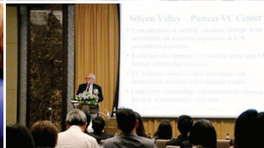
Financing APEC SME Workshop