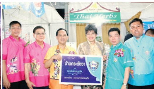
มหกรรม SMEs ของดีภาคใต้