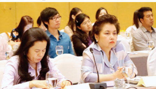
ชี้แจงกรอบแผนส่งเสริม SMEs ปี 59