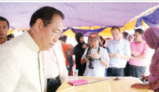
เยี่ยมชมโครงการพระดาบสสิขุจรวงศ์จังหวัดชายแดนใต้