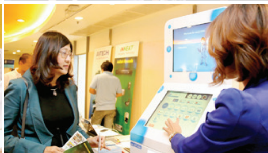
Franchise Guide 2014