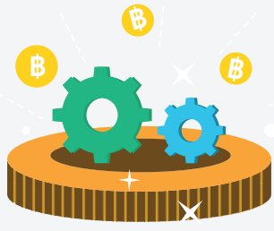
รายได้ประชาชาติ