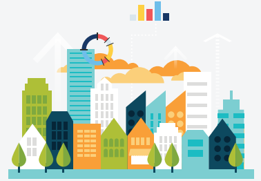
การกระจายรายได้ภาคครัวเรือน