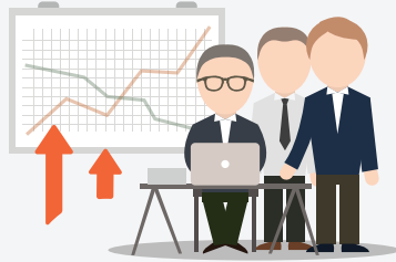
การจ้างงาน