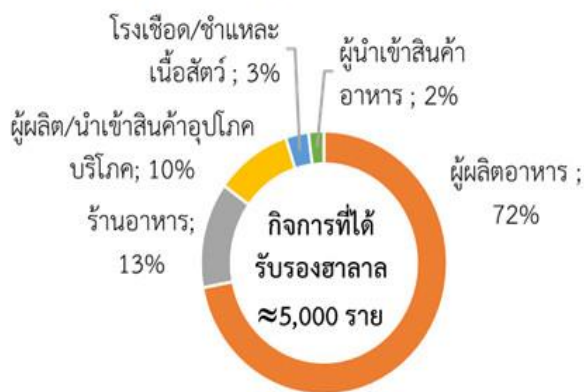
รูปที่ 1 สถานประกอบการในประเทศไทยที่ได้รับการรับรองมาตรฐานฮาลาล จำแนกตามประเภทกิจการ