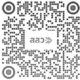
GDP MSME รายไตรมาส