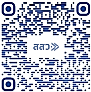
รายงานสถานการณ์ MSME Outlook