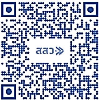
รายงานสถานการณ์ MSME รายเดือน