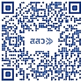
รายงานสถานการณ์ MSME ประจำปี