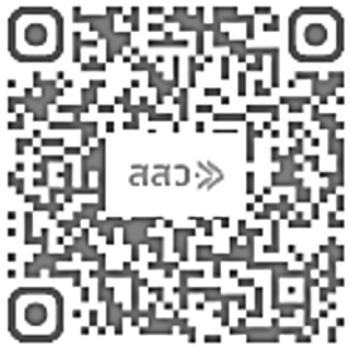
ดัชนีความเชื่อมั่น SME (SMESI)