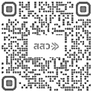
บทวิเคราะห์ MSME ในประเด็นที่สำคัญ และ บทวิเคราะห์ธุรกิจในสาขาธุรกิจที่สำคัญ