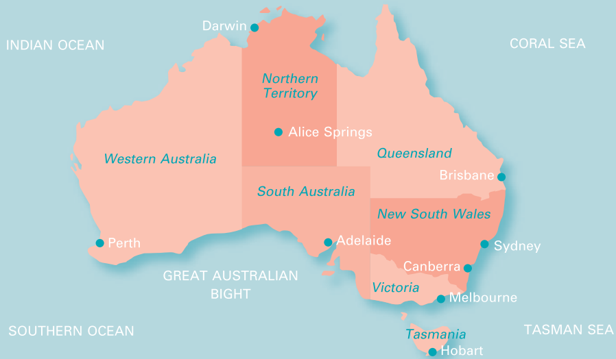
ภาพที่ 1 ที่ตั้งของรัฐแต่ละรัฐในประเทศออสเตรเลีย